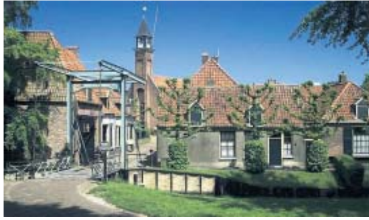
Klopt wat je ziet in het Zuiderzeemuseum met de werkelijkheid? Dat kunnen bezoekers met eigen ogen gaan zien tijdens het Museumweekend. FOTO HANS VAN WIEL

DOOR SONJA DE JONG De kunst van de waarheid. Dat is het intrigerende thema van het Museumweekend dat komend weekend weer in heel Nederland wordt gehouden. Ook in Noord-Holland openen vele musea de deuren en zijn gratis toegankelijk. Bovendien bieden zij tal van extra activiteiten. Een greep uit het aanbod.