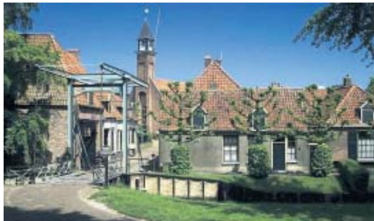
Klopt wat je ziet in het Zuiderzeemuseum met de werkelijkheid? Dat kunnen bezoekers met eigen ogen gaan zien tijdens het Museumweekend.

DOOR SONJA DE JONG De kunst van de waarheid. Dat is het intrigerende thema van het Museumweekend dat komend weekend weer in heel Nederland wordt gehouden. Ook in Noord-Holland openen vele musea de deuren en zijn gratis toegankelijk. Bovendien bieden zij tal van extra activiteiten. Een greep uit het aanbod.